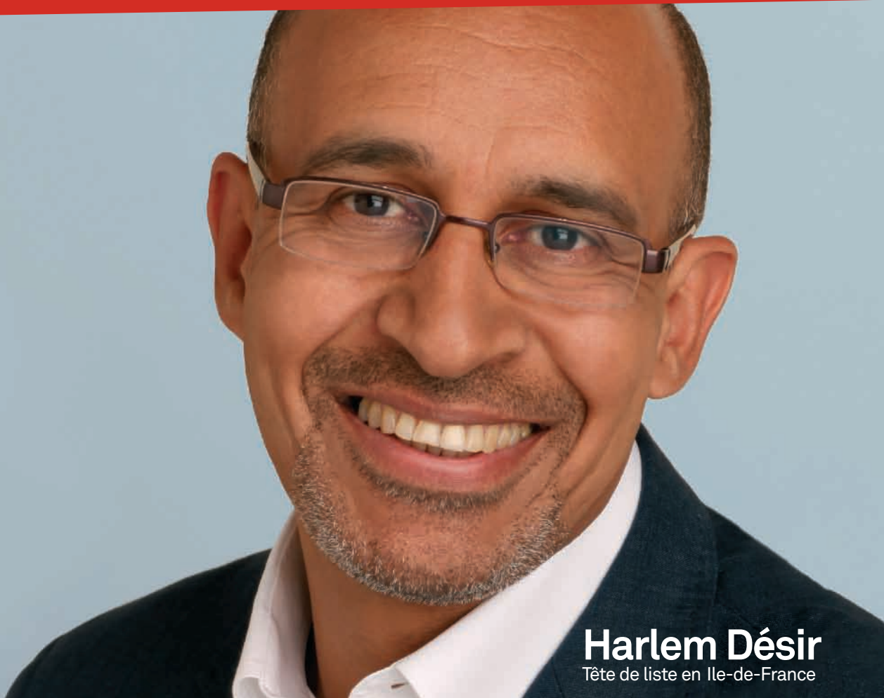
Harlem Désir Tête de liste en Ile-de-France